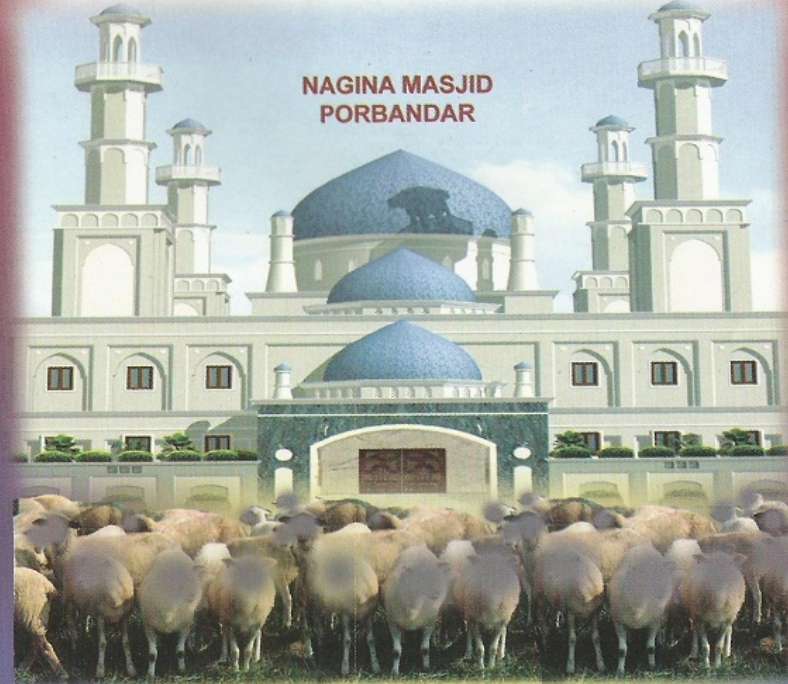
NAGINA MASJID PORBANDAR